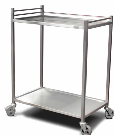
CARRO UTILITARIO EN ACERO INOXIDABLE O COBRE SKU: CU002000