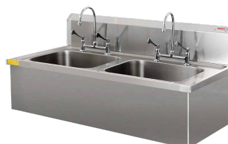
LAVAMANOS QUIRÚRGICO 2 TAZAS SKU: LQ1402TF Otras opciones:

SKU: LQ0701TF 1 TAZA C/ FALDON SKU: LQ0701T0 1 TAZA LINEA EUROPEA SKU: LQ1402TF 2 TAZAS C/ FALDON SKU: LQ1402T0 2 TAZAS LINEA EUROPEA SKU : LQ1903T0 3 TAZAS LÍNEA EUROPEA SKU : LQ1903TF 3 TAZAS C/ FALDON SKU: LQE29060 ESPECIAL 4 PERS. SKU: LQE15060 ESPECIAL 2 PERS. SKU: LQE22060 ESPECIAL 3 PERS. SKU: LQE701TF ESPECIAL 1 PERS.