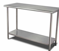
MESÓN TRABAJO CENTRAL OPPICI ACERO INOX. SKU: MT090CCO SKU: MT140CCO SKU: MT190CCO