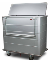
CARRO DE TRASLADO MATERIAL Y ROPA LIMPIA SKU: AL3950CR