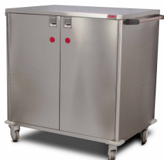
CARRO TRANSPORTE MATERIAL ESTÉRIL SKU: CME10467