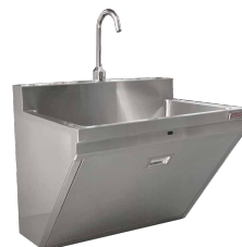
LAVAMANOS MURAL INCLINADO SKU: LQE701TF