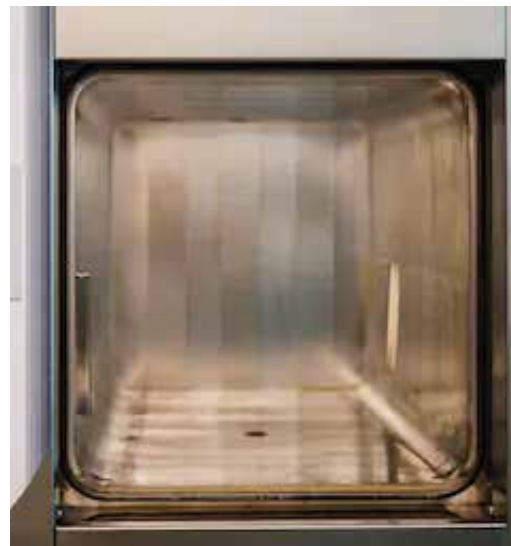
*Vista cámara interior