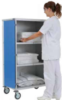
CARRO DE TRASLADO ROPA LIMPIA SKU: AV4000CR