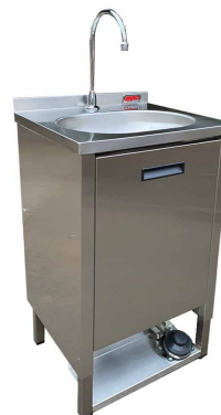
LAVAMANOS AUTÓNOMO SKU: LM045AUT