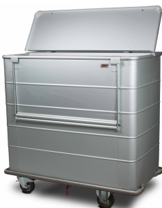
CARRO TRANSPORTE MATERIAL Y ROPA SUCIA SKU: AV4500CR