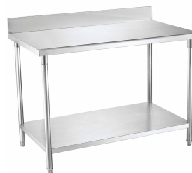
MESÓN TRABAJO MURAL OPPICI ACERO INOX. SKU: MT090MCO SKU: MT140MCO SKU: MT190MCO